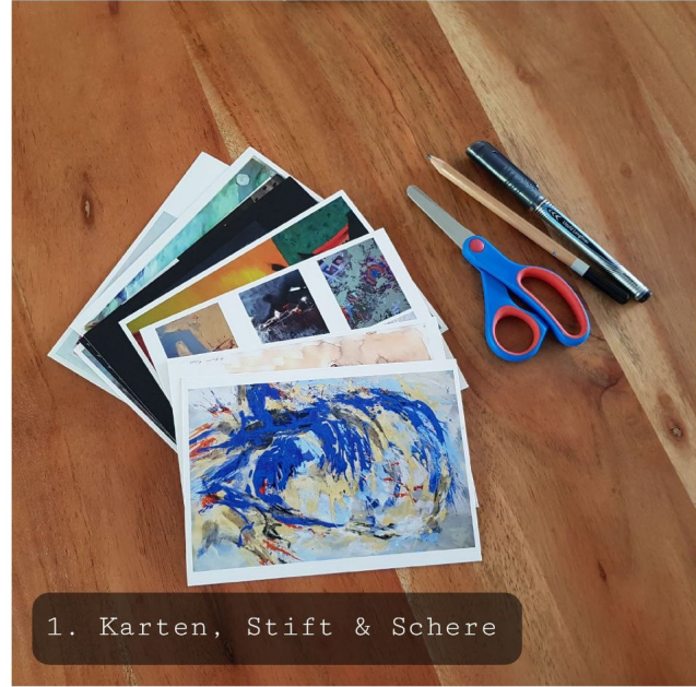
1. Karten, Stift & Schere