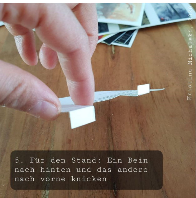
5. Für den Stand: Ein Bein nach hinten und das andere nach vorne knicken