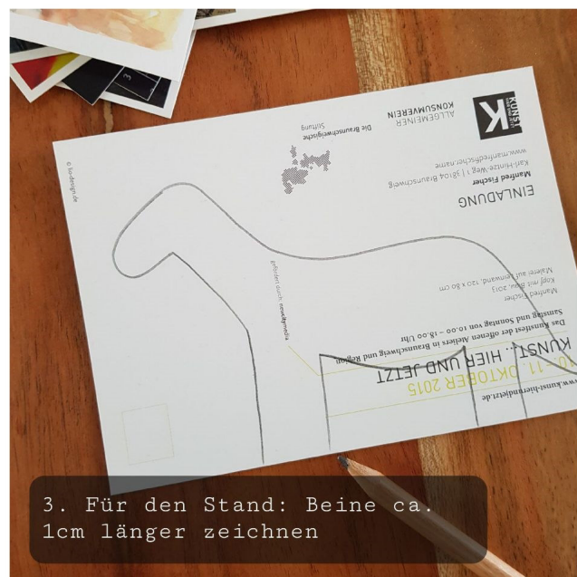
3. Für den Stand: Beine ca. 1cm länger zeichnen